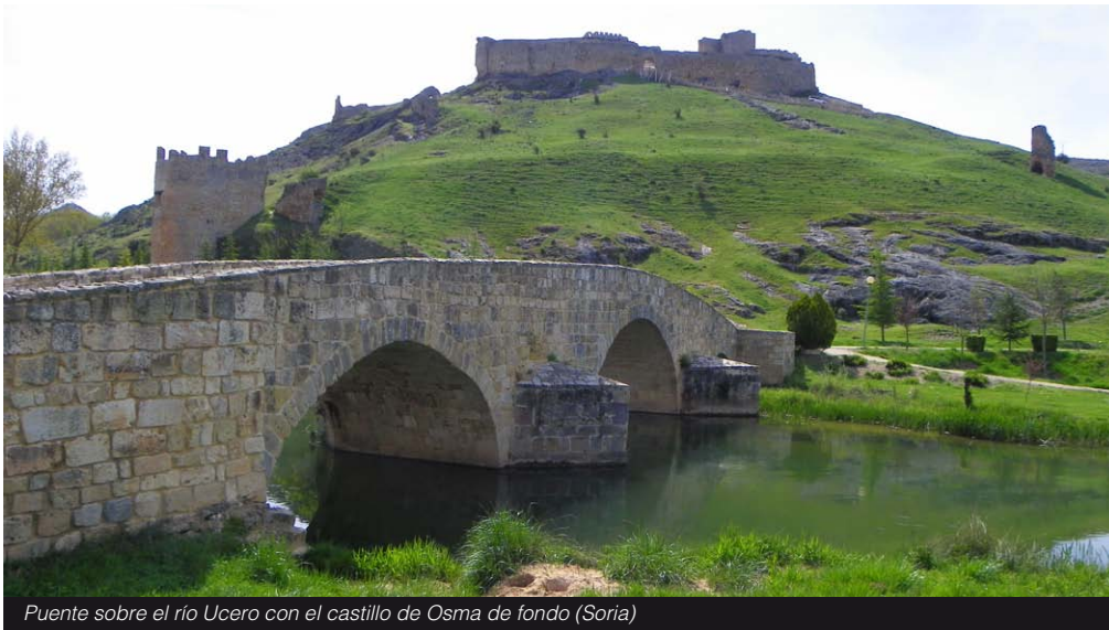
Puente sobre el río Ucero con el castillo de Osma de fondo (Soria)